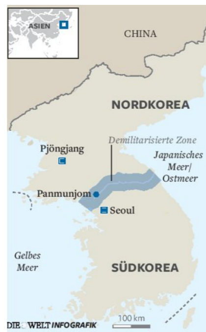
Der Flaggenmast auf der nordkoreanischen Seite der knapp 250 Kilometer langen und vier Kilometer breiten Demilitarisierten Zone ist 160 Meter hoch

In der Demilitarisierten Zone zwischen Nord- und Südkorea kann schon ein Fingerzeig Schüsse provozieren